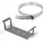
SaddleUp™ Galvanized Bracket Ménsula galvanizada Patte galvanisée 523-1