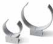
DWV ComboSaddle™ 523-712 and 523-734 523-712 y 523-734 523-712 et 523-734