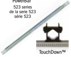
TouchDown™ Universal Pipe Clamp Abrazadera universal para tuberías Bride de tuyau universelle 523-5500

PowerBar 523 series de la serie 523 série 523